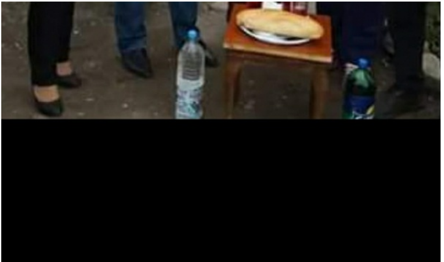
Descriere foto: Foto: Alexandru Căuțiș