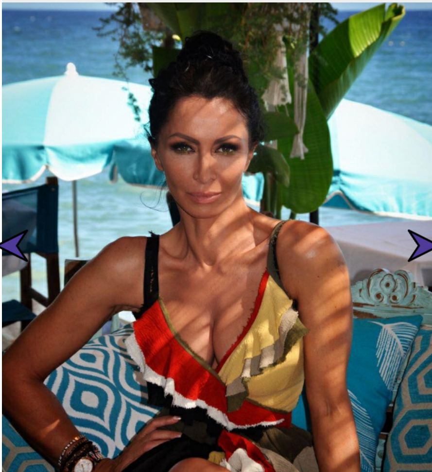
Descriere foto: Mihaela Rădulescu