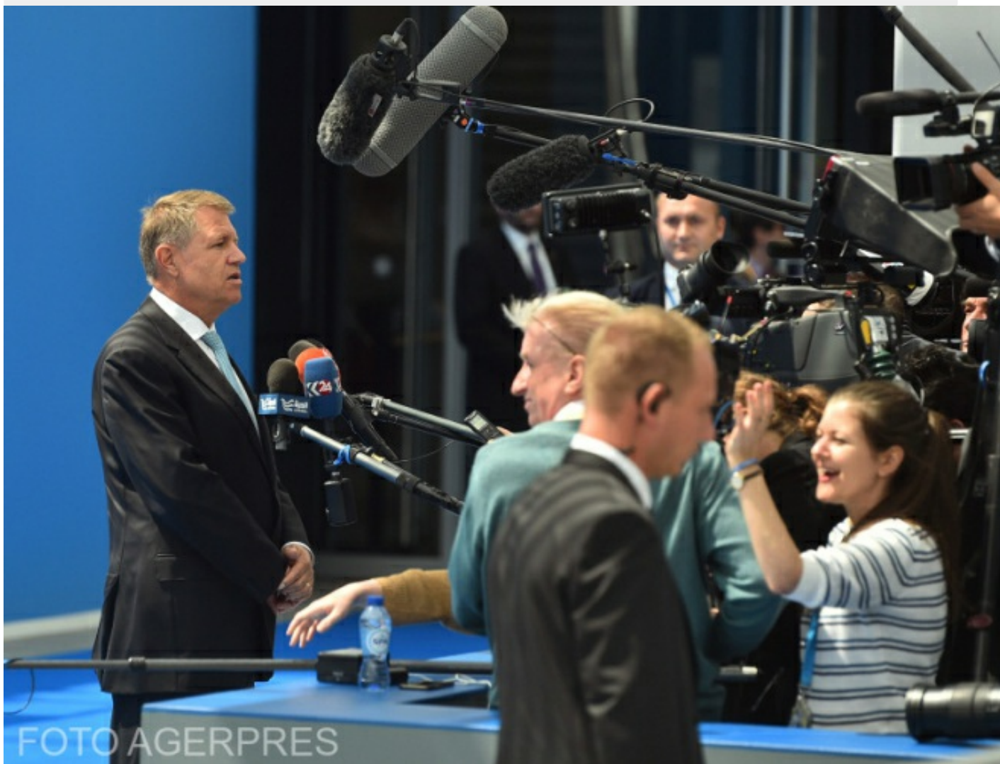
Descriere foto: Iohannis

Klaus Iohannis a semnat decretul de revocare al șefei DNA, Laura Codruța Kovesi.