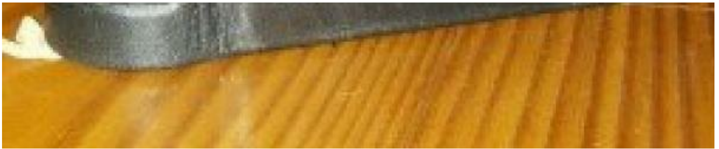
Descriere foto: Ceaslov din 1835 - premiat la Salonul Național de Restaurare de la Craiova